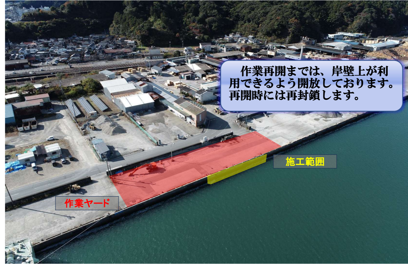
現場付近を上空から（12月末時点）